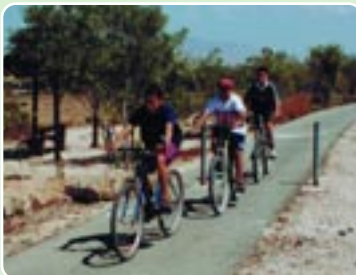
Ποδηλατόδρομος - πεζόδρομος

Για τη διακίνηση του κοινού εντός του Πάρκου έχουν κατασκευαστεί 6 χιλιόμετρα ασφαλτόδρομοι, 16 χιλιόμετρα ποδηλατόδρομοι και 18 χιλιόμετρα πεζόδρομοι. Επίσης υπάρχουν αρκετά χιλιόμετρα διαχειριστικών δρόμων.