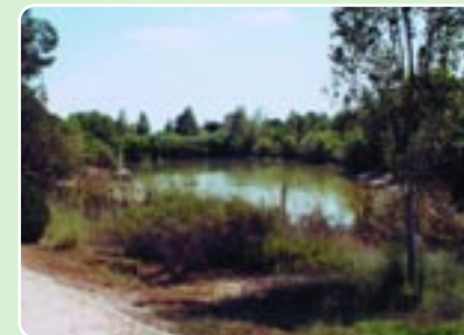
Λίμνη Αγίου Γεωργίου

Το έργο αυτό είναι το πρώτο που έχει υλοποιηθεί μέσα στα πλαίσια ανάπτυξης του Εθνικού Δασικού Πάρκου Αθαλάσσας. Είναι έκτασης 10,5 εκταρίων περίπου και για την ανάπτυξή του ετοιμάστηκε μελέτη από το Τμήμα Δασών σε συνεργασία με άλλες υπηρεσίες, το Φιλοδασικό Σύνδεσμο και το Δήμο Αγλαντζιάς. Περιλαμβάνει έργα όπως μικρό εκδρομικό χώρο, περίπτερο, παιδική χαρά, χώρους αθλοπαιδιών, εγκατάσταση συστημάτων ύδρευσης και άρδευσης, διευκολύνσεις για τους περιπατητές, μονοπάτι περιπάτου, τοπιοτέχνηση και βελτίωση του μικρού φράγματος που δίδει μια ειδυλλιακή όψη στο τοπίο της περιοχής.