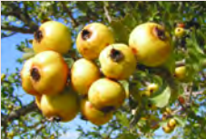
Crataegus azarolus, Μοσφιλιά

43. Sarcopoterium spinosum , Μαζίν: Βλήπε αριθμό 39.