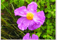
Cistus creticus var. creticus, Ξυσταρκά

74. Genista sphacellata , Ρασίν, Σπαλαθικιά: Βλήπε αριθμό 48.