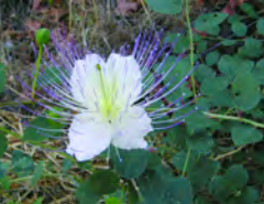
Capparis spinosa var. canescens, Κάπαρη

42. Calycotome villosa , Ασπάλαθος, Σπαλαθικιά: Βλήπε αριθμό 25.