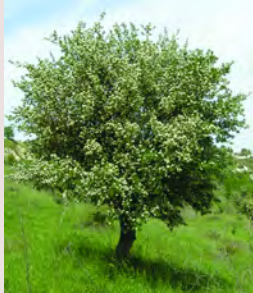
Crataegus azarolus, Μοσφιλιά