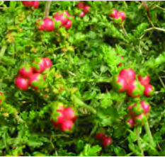
Sarcopoterium spinosum, Μαζίν